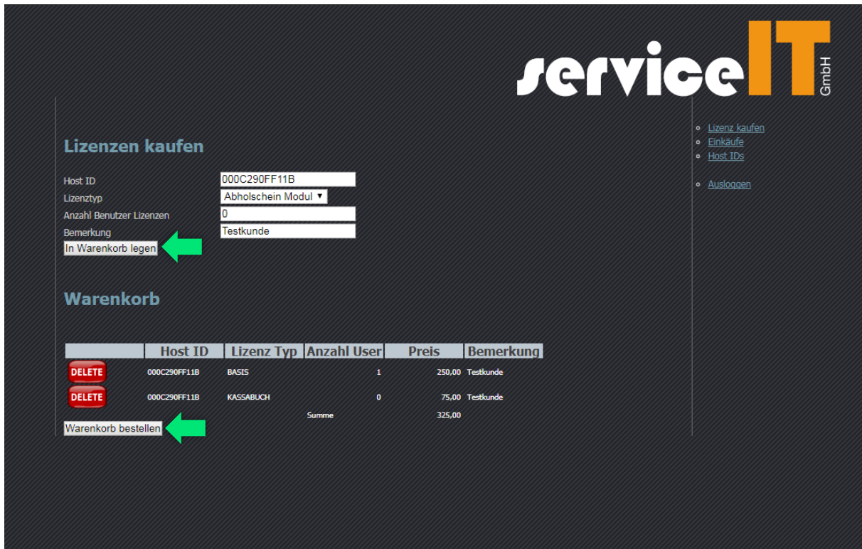
Abb. 2-3: Eingabe der Daten und Bestellung der Lizenzen