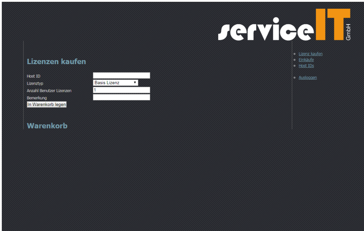
Abb. 2-2: Maske zum Kauf von Lizenzen

Nach der Anmeldung gelangt man auf die Maske für den Kauf von Lizenzen. Anzugeben sind die Host ID, der Lizenztyp, gegebenenfalls die Anzahl der Benutzer und eine Bemerkung.