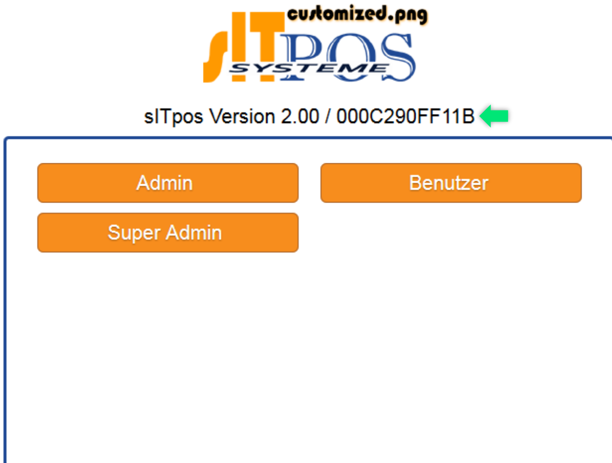
Abb. 1-1: Benutzerauswahl

Angezeigt wird diese auf der Benutzerauswahl, rechts neben der Versionsnummer, bzw. ist diese auch unter „Menü Admin → Konfiguration → Konfigurationsthema auswählen: Lizenzen verwalten“ einzusehen.